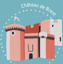
Château de Brest